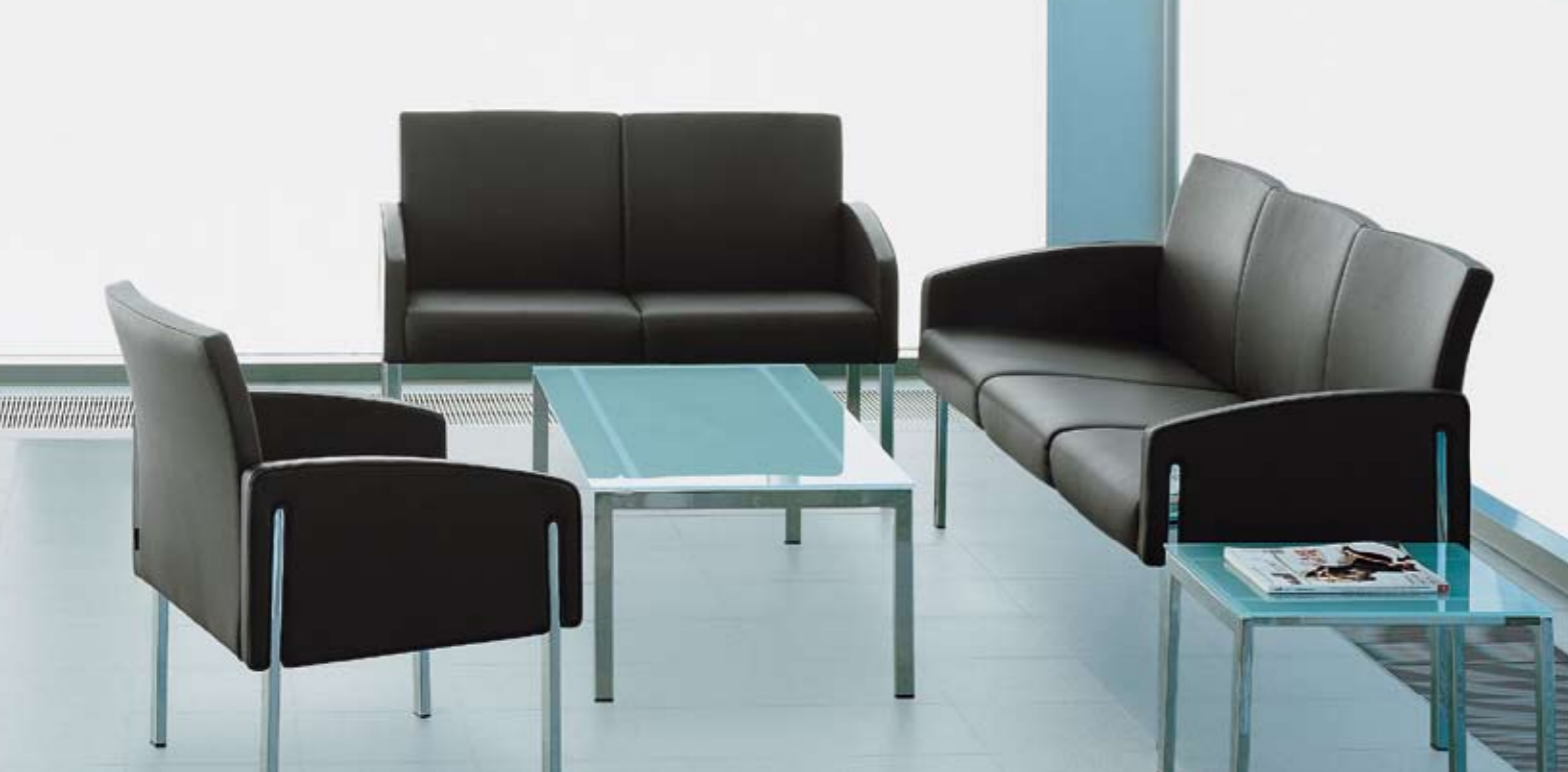
FP 15010 Einsitzer/Single-seater