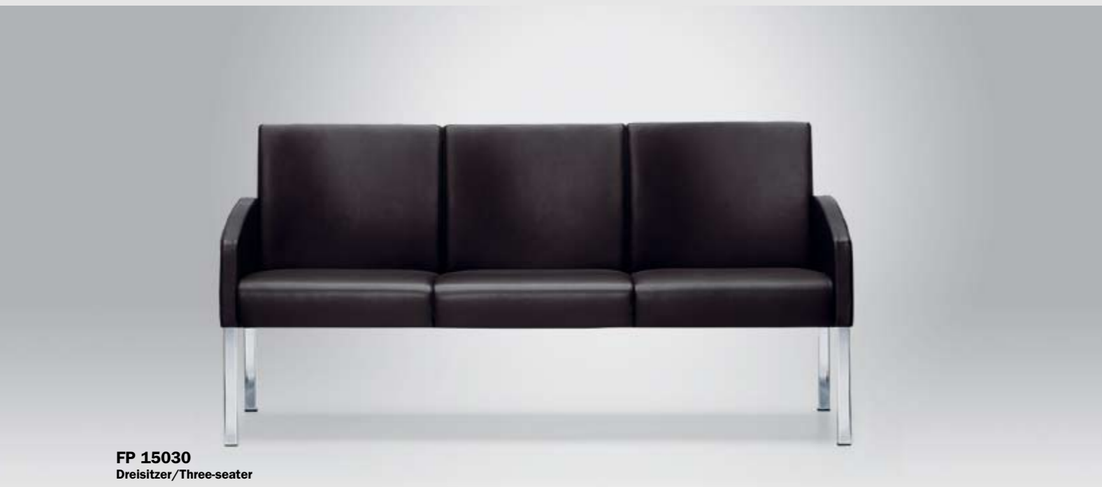
FP 15030 Dreisitzer/Three-seater