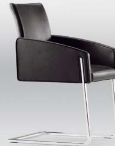
FP 15050 Freischwinger/Cantilever