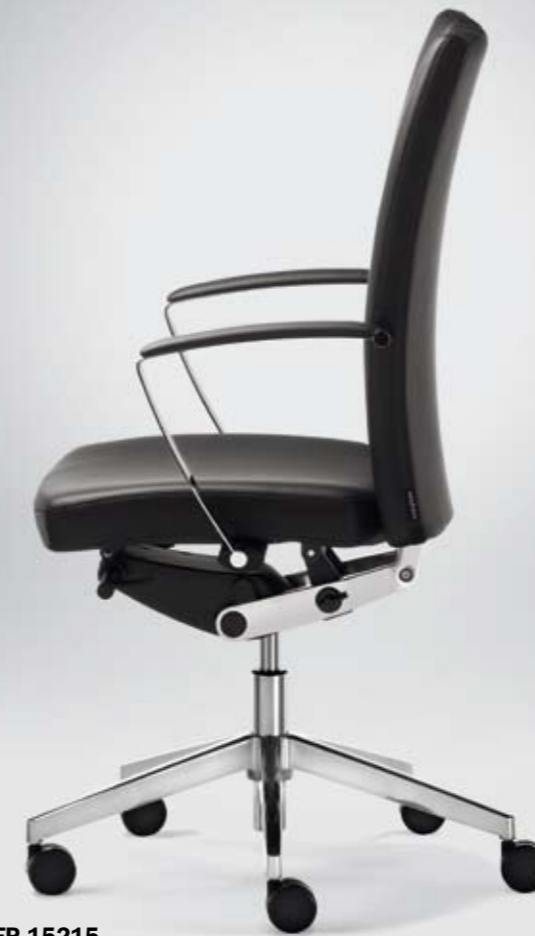
ES FP 15215 + Armlehnen/Armrests 302