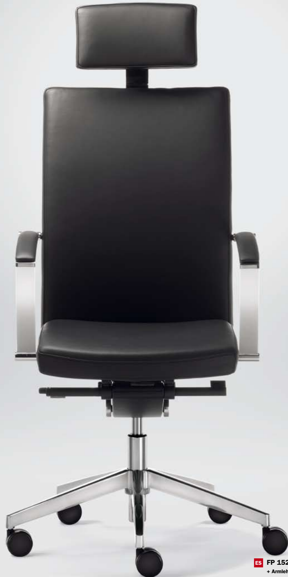
ES FP 15265 + Armlehnen/Armrests 302