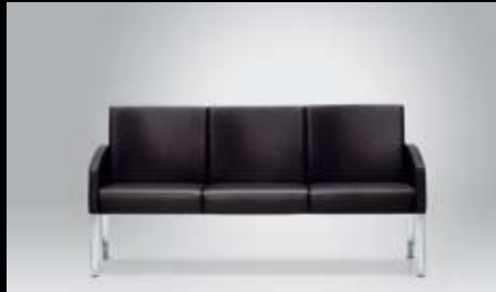
FP 15030 (FP 15020 ohne Abb./ FP 15020 not illustrated)