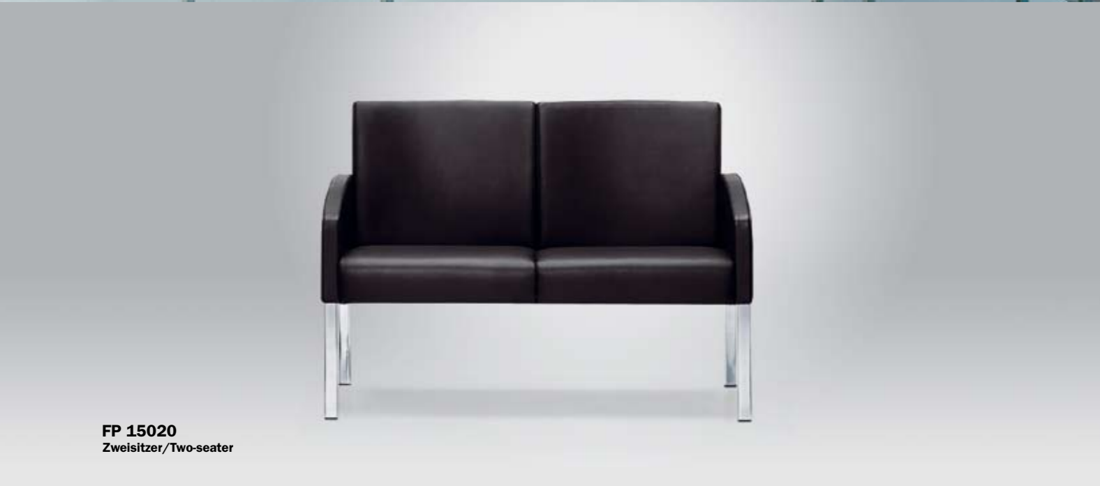
FP 15020 Zweisitzer/Two-seater