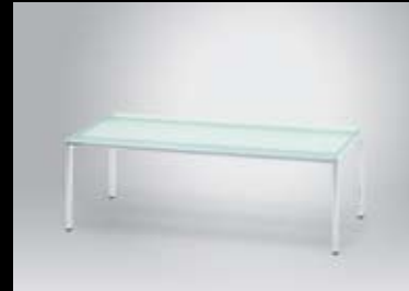
FP 15130 (FP 15110 ohne Abb./ FP 15110 not illustrated)