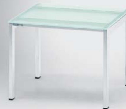
FP 15110 Kleiner Beistelltisch/Small side table